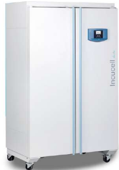
Incucell Incubadora 707 L.