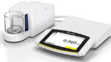
Cubis II Microbalanzas