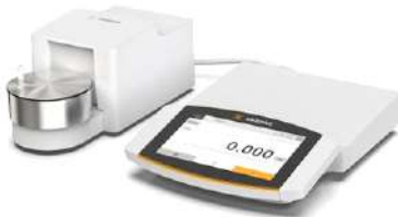
Cubis II Ultramicro Balanzas