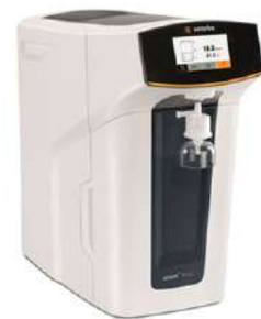
Purificador de Agua Tipo I y tipo II Sartorius ARIUM MINI®