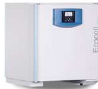
Ecozell Horno de secado 55 L.