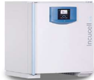
Incucell Incubadora 55 L.