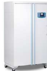
Ecozell Horno de secado 707 L.