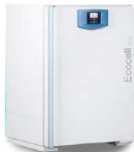
Ecozell Horno de secado 222 L.