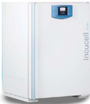
Incucell Incubadora 222 L.