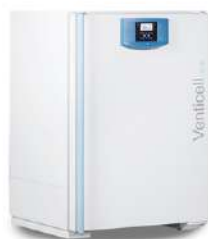
Venticell Horno de secado 222 L.