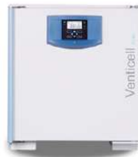
Venticell Horno de secado 55 L.