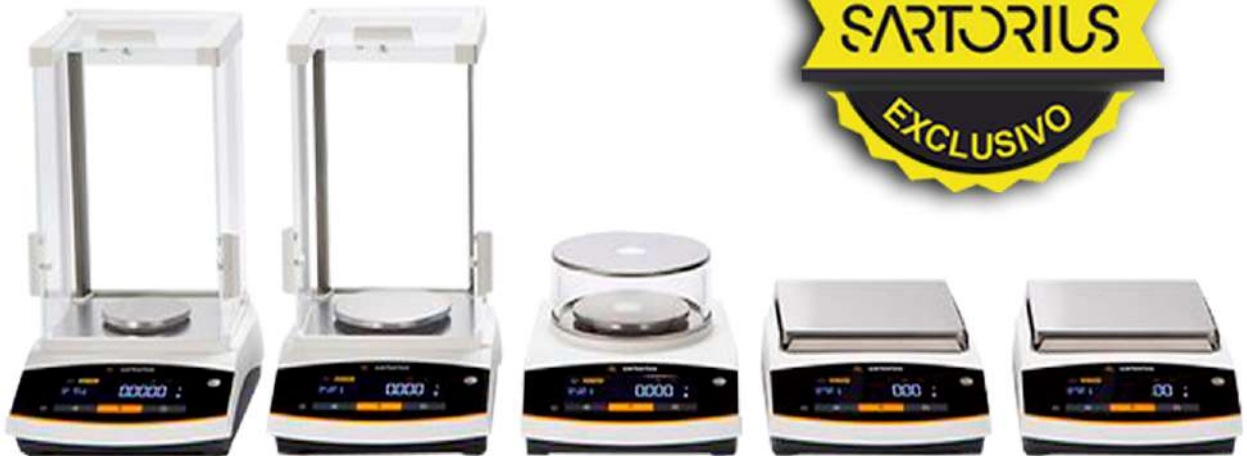
BCE Entris II Balanzas Analíticas y Precisión