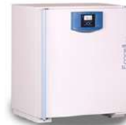
Ecozell Horno de secado 111 L.