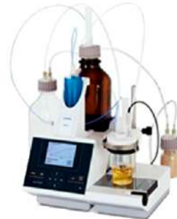
TitroLine® 7500 KF