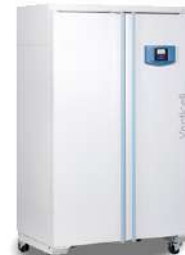
Venticell Horno de secado 111 L.