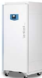
Venticell Horno de secado 404 L.