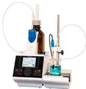
TitroLine® 7750 KF