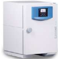
Ecozell Horno de secado 22 L.