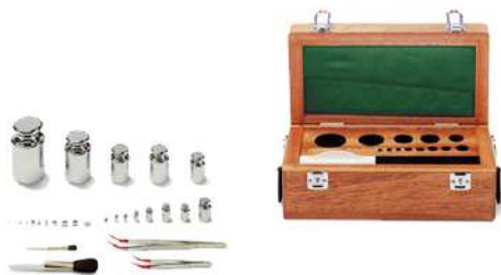
Set de Pesas en estuche de madera