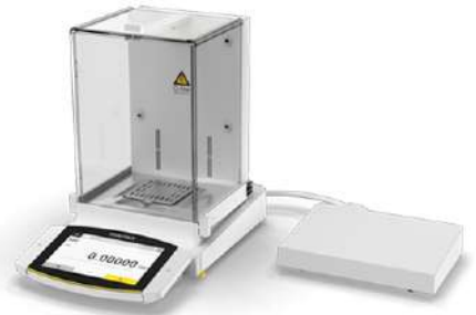
Cubis II Semi-Microbalanzas