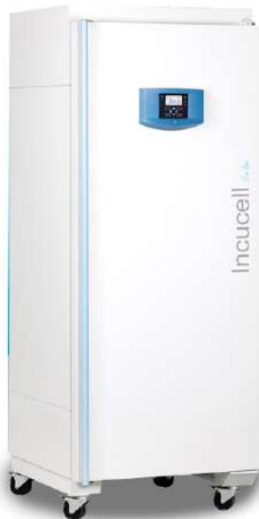
Incucell Incubadora 22 L.