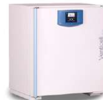
Venticell Horno de secado 111 L.