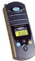
Portátil 420 nm