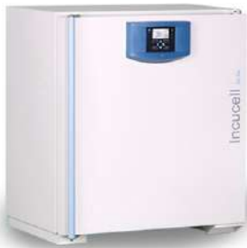
Incucell Incubadora 11 L.