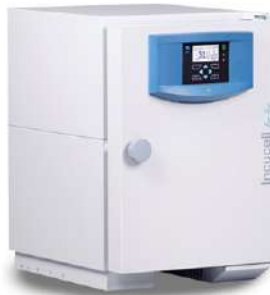
Incucell Incubadora 22 L.