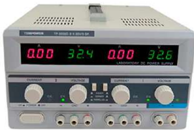
Fuente de poder