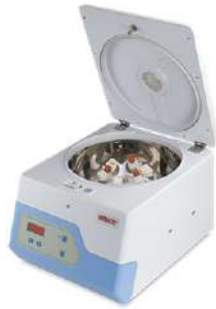
Centrifuga Clínica PowerspinHX 6 Vel. Fija.