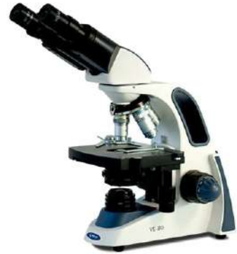
Microscopio Binocular Biológico VE-B0