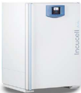
Incucell Incubadora 222 L.