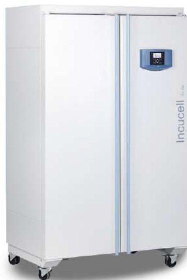
Incucell Incubadora 707 L.