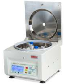
Centrifuga Clínica PowerspinDX Vel. Variable.