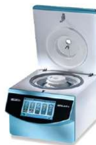
Centrifugas de lavado ROTOLAVIT II