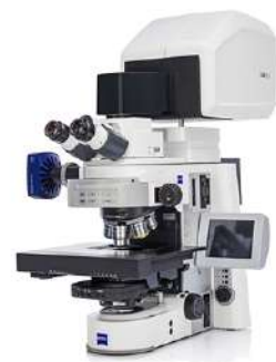
Confocal Microscope ZEISS LSM 900 for Materials