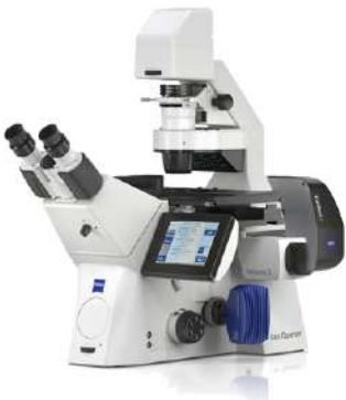
ZEISS Axio Observer