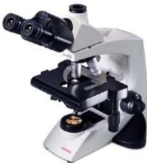
Microscopio Biológico Compuesto LX 400