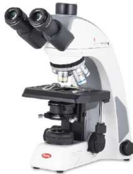
Panthera C2 Triocular 50:50