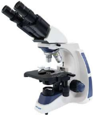
Microscopio Binocular Biológico VE-B1