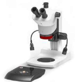
Microscopio Triocular Biológico con Fototubo