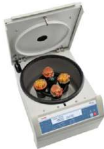
Centrifugas sobremesa Megafuge™ 8