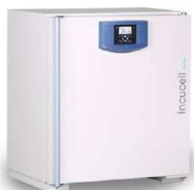
Incucell Incubadora 11 L.