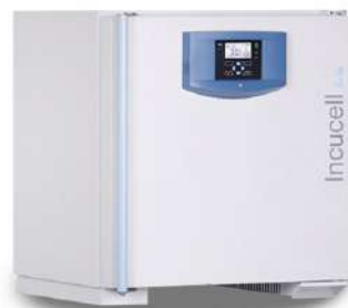
Incucell Incubadora 55 L.