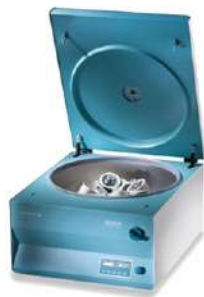
Centrifuga de sobremesa ROTANTA 460R