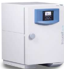
Incucell Incubadora 22 L.