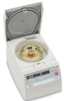
Microcentrifugas series MicroCL 17 y 21