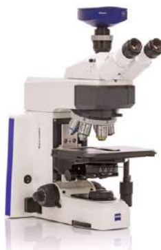
ZEISS Axioscope 5