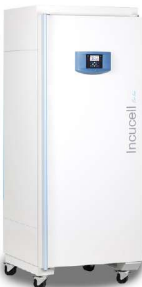
Incucell Incubadora 22 L.