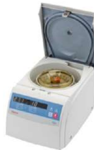
Microcentrifugas Pico™ y Fresco™