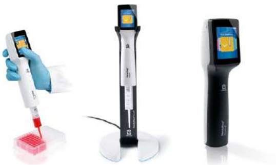
Handy Step Series