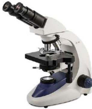
Microscopio Binocular Intermedio VE-B5