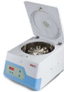
Centrifuga Clínica PowerspinHX 12 Vel. Fija.