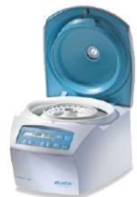
Microcentrifugas MIKRO 185