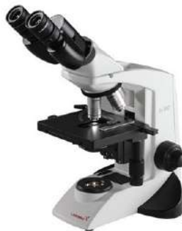
Microscopio Binocular Biológico LX300 Iluminación Led